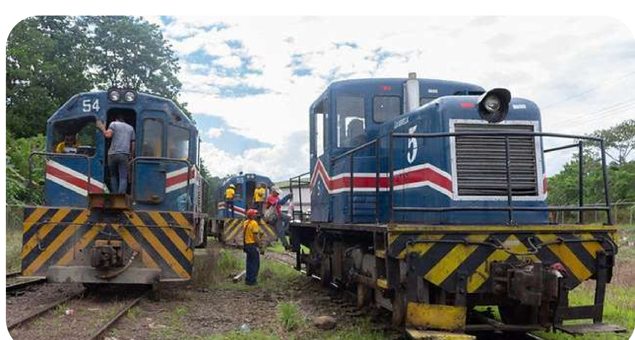
Fotografía: Reparaciones a actual línea ferroviaria en Limón

Reactivación fue posible tras la modernización de 2 patios ferroviarios: el de la terminal de Moín y la construcción del espacio de Leesville. Con esta medida se agilizará el movimiento de carga en el Atlántico y se aumentará el flujo de mercancía en un tramo de la ruta 32.