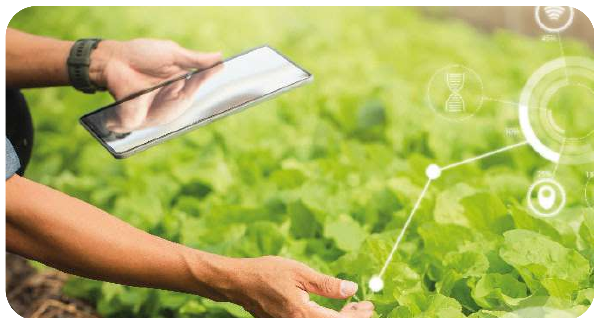
Fotografía con fines ilustrativos

Un total de 20 nuevas pymes fueron seleccionadas para iniciar un proceso de transformación productiva verde, a través de fondos no reembolsables y asesoría empresarial para incrementar su competitividad de cara a los mercados internacionales.