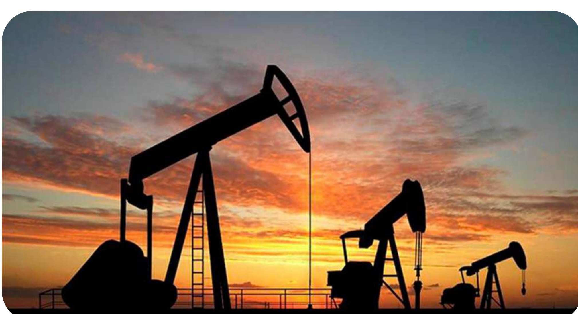
Fotografía con fines ilustrativos

Los precios del petróleo retrocedieron el martes 13 de septiembre tras la publicación de la inflación en Estados Unidos, que sigue alta, lo que hace temer una recesión y un debilitamiento de la demanda mundial.